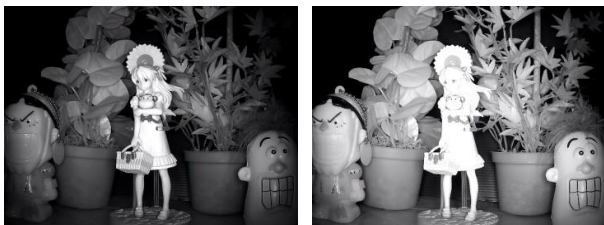
trójstopniowa regulacja mocy oświetlacza