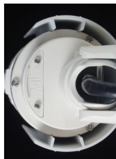
Zewnętrzny slot na kartę SD