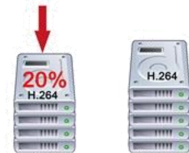
Oszczędność 20% miejsca na dysku