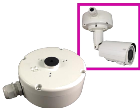
YUK-D06 Puszka montażowa