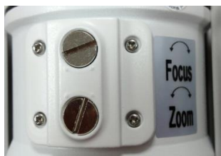
Zewnętrzna regulacja obiektywu